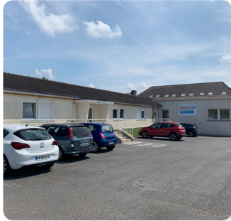
Site de Noyon