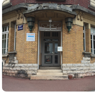
Antenne de Montdidier