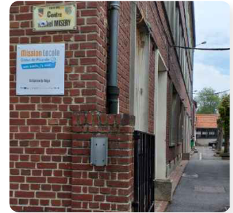
Antenne de Roye

3 sites + Noyon - Montdidier - Roye 1 permanence Centre Social de Guiscard